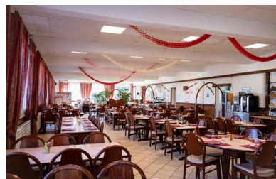
Salle de restaurant