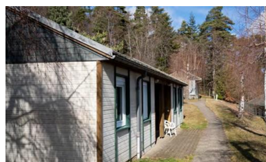
Exemple de Bungalows