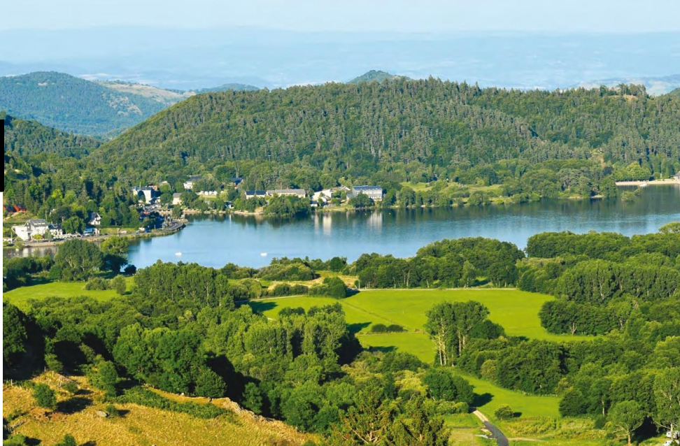
Vue panoramique sur la château de Murol et le lac Chambon

Un large choix d'excursions et de parcours rando ou cyclo, sélectionnés pour enrichir vos séjours « Liberté » et « Prêts à Partir ».